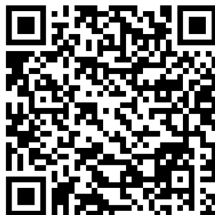
QR-Code zur Homepage der Stadt Mühlacker