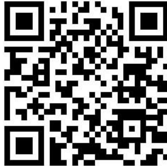
QR-Code zum Beteiligungsportal der Stadt Mühlacker

Für die Mitwirkung an der Beteiligung ist eine vorherige Registrierung im Beteiligungsportal notwendig. Alternativ kann die Stellungnahme auch per E-Mail an oeffentlichkeitsarbeit@stadt-muehlacker.de gesendet werden.